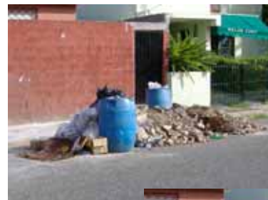
Antes del PPP (Real)

Las lecciones aprendidas y la experiencia obtenida en el proyecto, permitirá al ADN extender los beneficios al resto de los barrios del DN y administrar de mejor manera los servicios contratados con el sector privado.