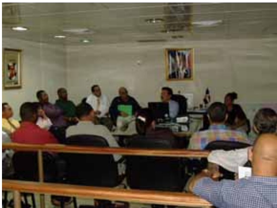
Los representantes de la Junta de Vecinos preguntaron sobre el proyecto y expresaron sus opiniones al respecto.