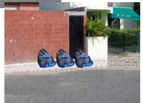
Después del PPP (Imagen)

Dirección de Gestión Ambiente y Aseo Urbano, Ayuntamiento del Distrito Nacional y Equipo de Estudio de JICA Edificio Consistorial/Ayuntamiento 2do piso Costado Oeste del Parque Colón Ave. Arzobispo Meriño esq. Conde, Distrito Nacional, República Dominicana