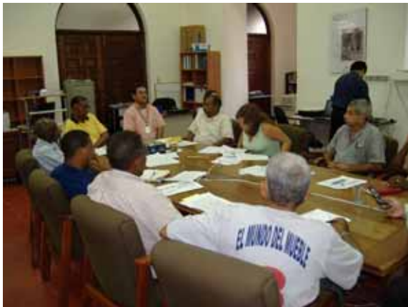
Funcionarios del ADN se reunieron para preparar el proyecto.